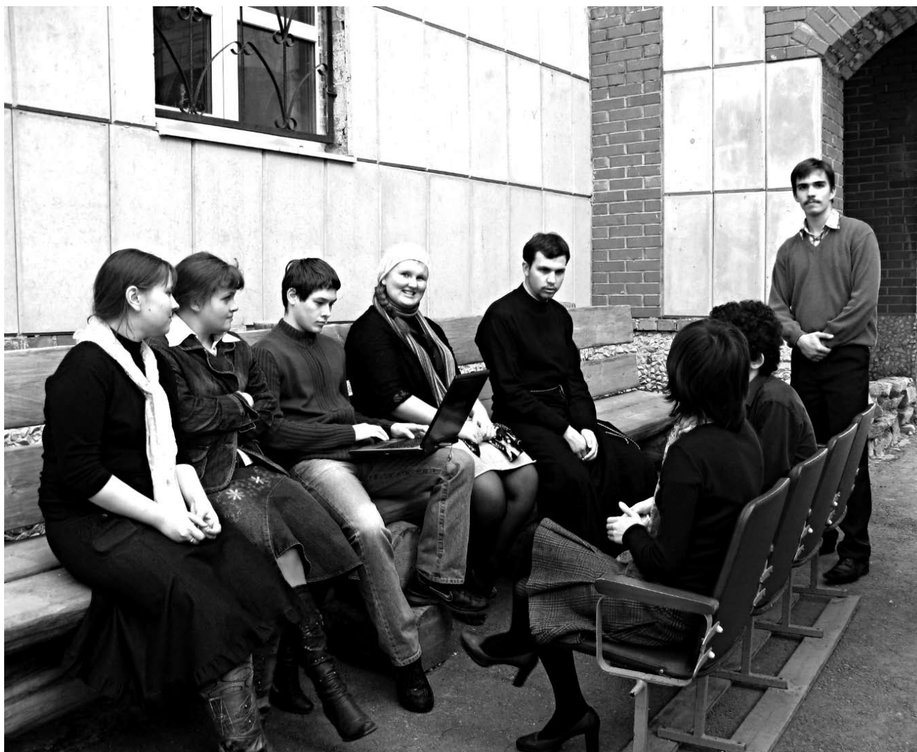
Молодежная группа храма св. цел. Пантелеимона

Возможно, но с большим трудом, хотя бы потому, что студент в вузе серьезно загруз-