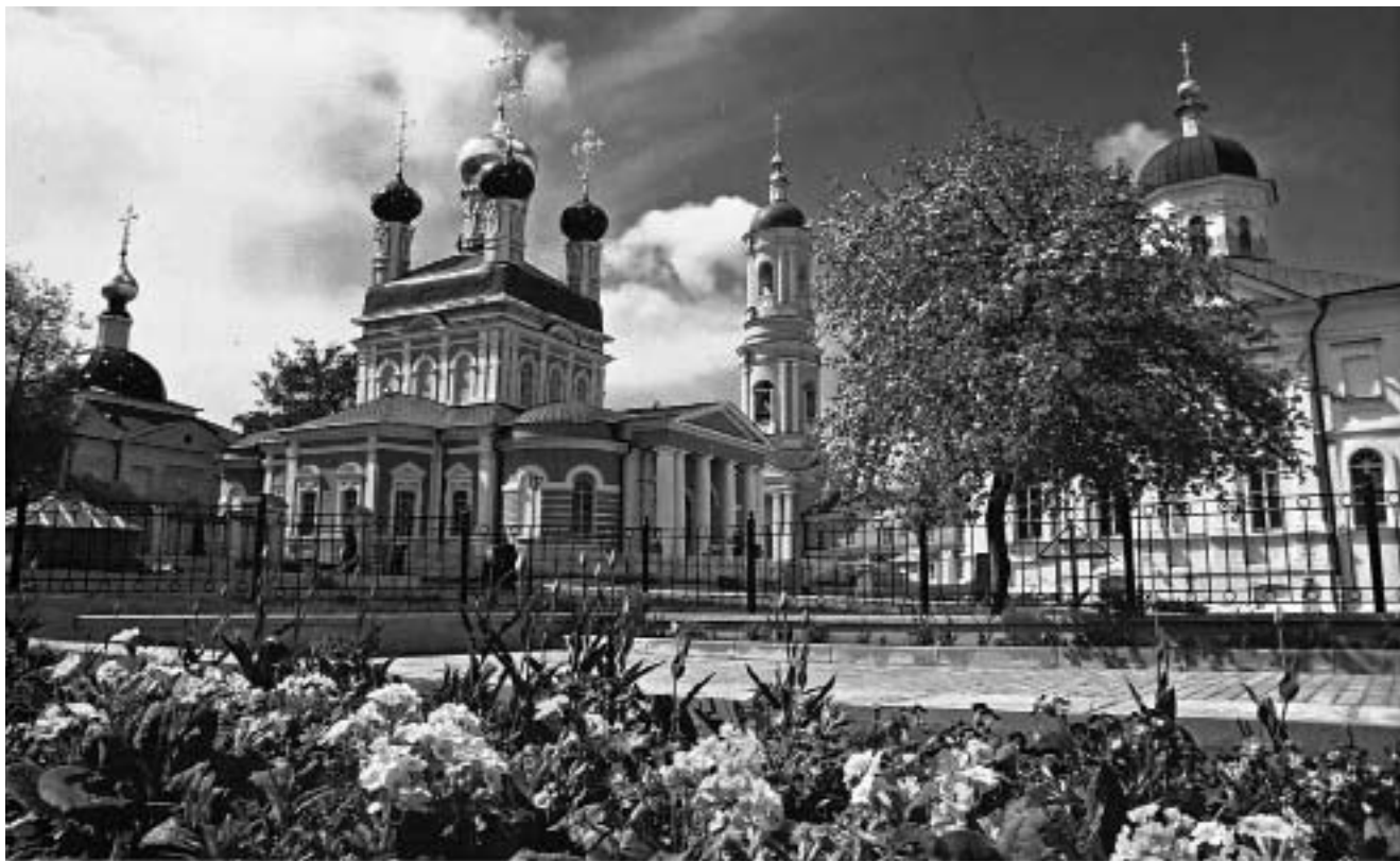
Свято-Введенский собор в Оптиной Пустыни, где почивают мощи св. прп. Нектария Оптинского

За три месяца до закрытия скита старца Нектария